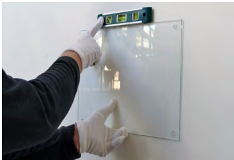
4 Löcher anzeichnen und bohren