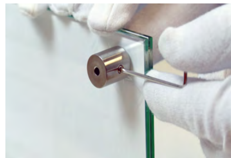
Glasscheiben an Abstandshalter (an der Wand) festschrauben