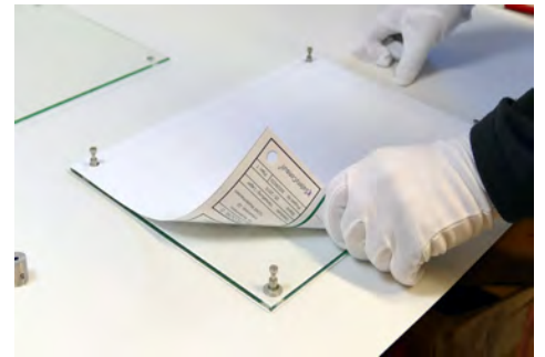
Plan lochen und einlegen