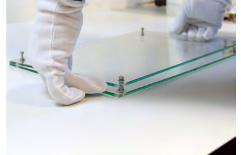
2 Scheiben trennen